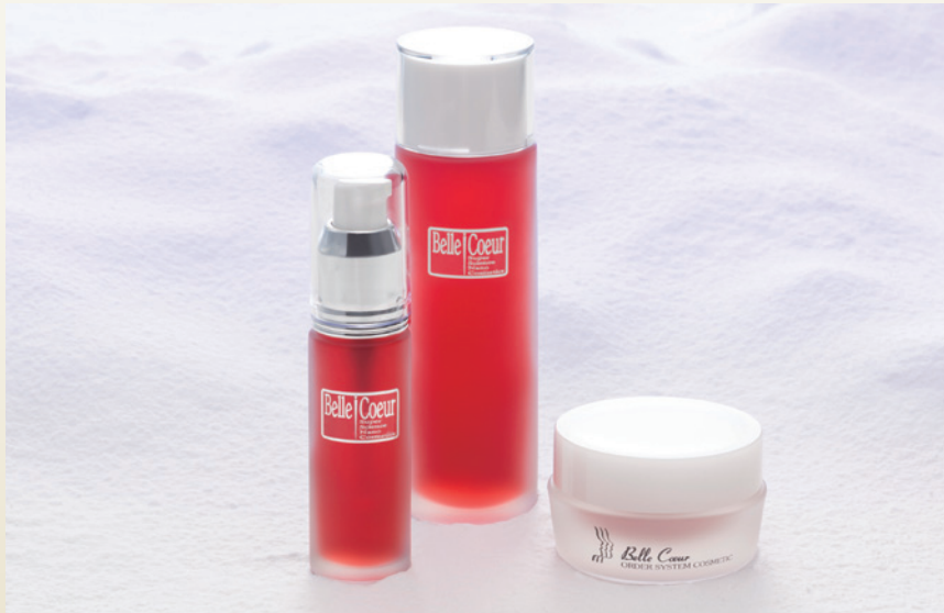
「北美人」シリーズ 左から美容液、化粧水、クリーム