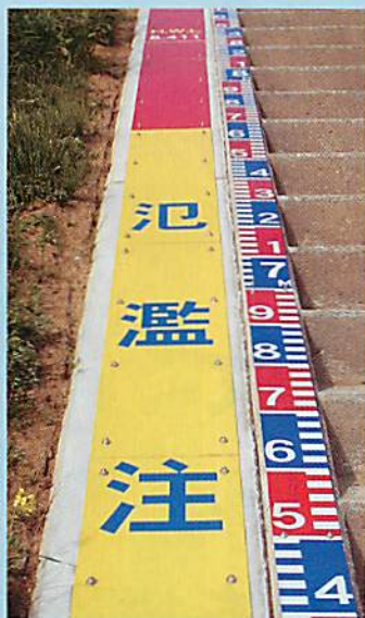
(上) 危険レベルが一目で分かる洪水痕跡機能付量水標 (左) 斜めからでも見やすいデザイン量水標