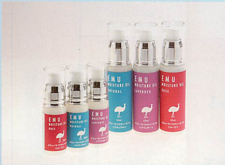
無臭タイプのほかに、バラやラベンダーの香りをブレンドした商品もある

エミューの油を使ったスキンケア商品が認証された。代表商品であるエミューモイスターオイルは、高い皮膚浸透性と保湿効果、そして肌トラブルに有益とされる酸化防止の3つの主な機能が評価に結びついた。