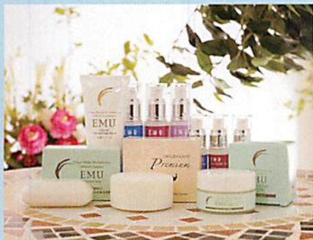
同じくエミュー油を使用したクリームやソープも展開