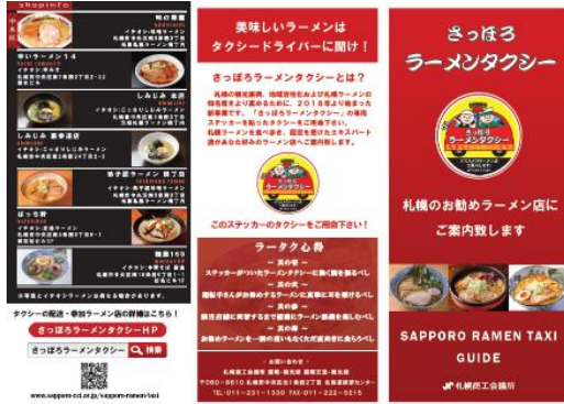
リーフレット（A4サイズ三つ折）