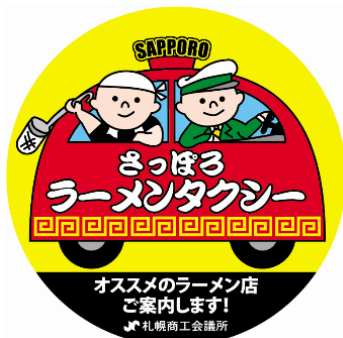
認定ステッカー（見本）

②ラーメンタクシー認定ドライバーは必ず車両に認定ステッカー掲出をお願い致します。