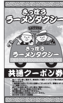
共通クーポン券（見本）

②ラーメンタクシー認定ドライバーは必ず車両に認定ステッカー掲出をお願い致します。