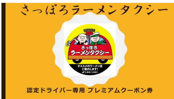
認定ドライバー専用 プレミアムクーポン券 デザイン（イメージ）

③認定ドライバーのみが使用できる、共通クーポン券よりも割引率が高い等の一段上の特典を受けられるプレミアムクーポン券を支給します。（対応可能店舗のみ使用可能）