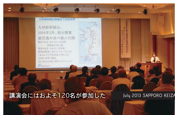
講演会にはおよそ120名が参加した