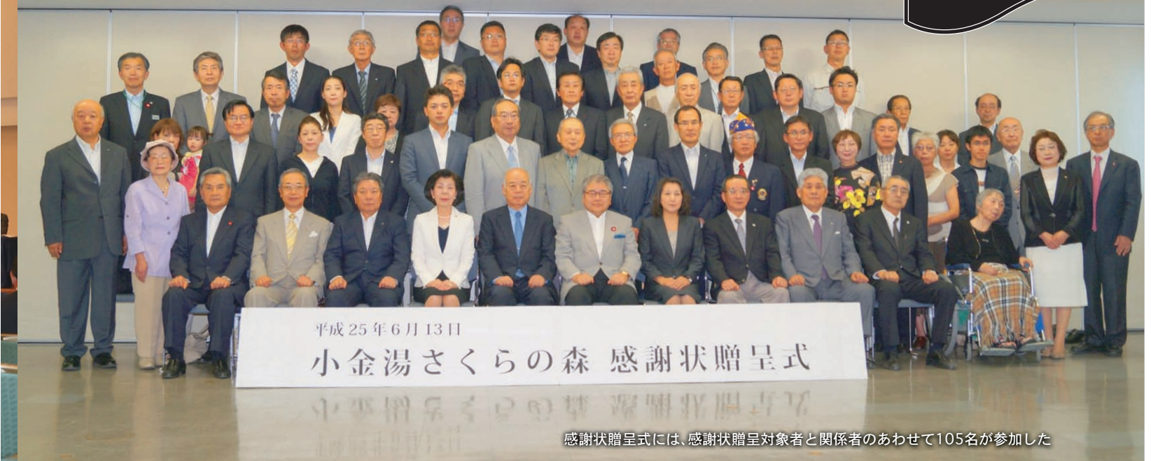
感謝状贈呈式には、感謝状贈呈対象者と関係者のあわせて105名が参加した

小金湯農業センター跡地に新たな桜の名所を造成しようと当所が設置した「札商小金湯さくらの森募金協会」を通じ、5万円以上を寄付した個人・団体に札幌市より感謝状が贈呈された。