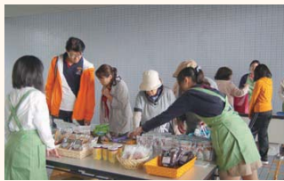
多くの地域の方が訪れた

札幌商工会議所付属専門学校(CA)では、同校のある白石東地区の地域住民と交流することを目的として「地域還元フェア」を開催した。