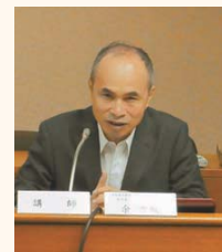
講演する余副代表