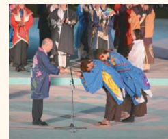
会頭賞を贈呈する高向会頭(左)

六月五日から開催された「第二十二回YOSAKOIソーラン祭り」。当所では、毎年実行