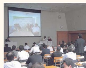
オンライン会議の様子

道内企業のロシア進出に向けて「ロシアオンラインセミナー」(主催:ジャパンエキスポート実行委員会、協力:当所)を開催した。