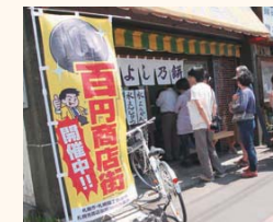
発寒商店街の様子