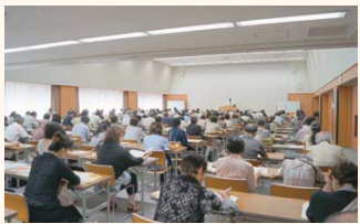
延べ約600名の参加があった

平成二十六年一月より、事業所得、不動産所得または山林所得がある全ての白色申告者の方が記帳と帳簿書類の保存が必要となることから、新たに對