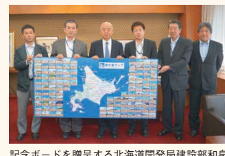
記念ボードを贈呈する北海道開発局建設部和泉課長(左から2人目)と高向会頭(左から3人目)