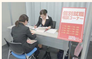
個別就職相談の様子

外国人留学生を対象に、社会に求められる人材として育成し、道内企業への就職支援を行う「札幌アジア・ブリッジ・プログラム」。今回は、道内企業に就職を希望する外国人留学生を対象に「内定獲得のための就職活動フェア」を開催した。