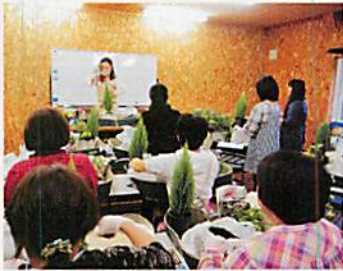
寄せ植え体験の様子

北海道の気候に適したガーデニング知識の向上を目的に、北国のガーデニング知識検定の合格者やガーデニング愛好家を対象としてスキルアップ研修を行った。