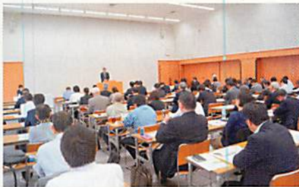
当日は100名の参加があった

日頃、取引先からの違法行為の強要やダンピング行為などにより立場の弱い中小零細企業が泣き寝入りしないためにも、正しい法令の知識を身に付けてもらうことを目的にセミナーを開催。