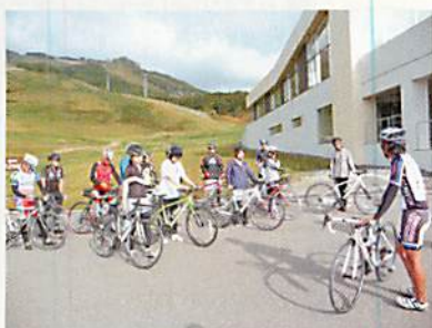
モニターツアーの様子

サイクリングを新たな観光資源として観光客誘致に取り組んでいる「サイクル・ツーリズム北海道推進連絡会」では、今後のサイクリングツアーのニーズを把握するため、モニターツアーを開催した。