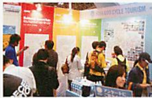
多くの来場者で賑わった

サイクリングを新たな観光資源として観光客誘致に取り組んでいる「サイクル・ツーリズム北海道推進連絡会」では、千葉幕張メッセで行われた「サイクルモードインターナショナル二〇一三」に出展した。