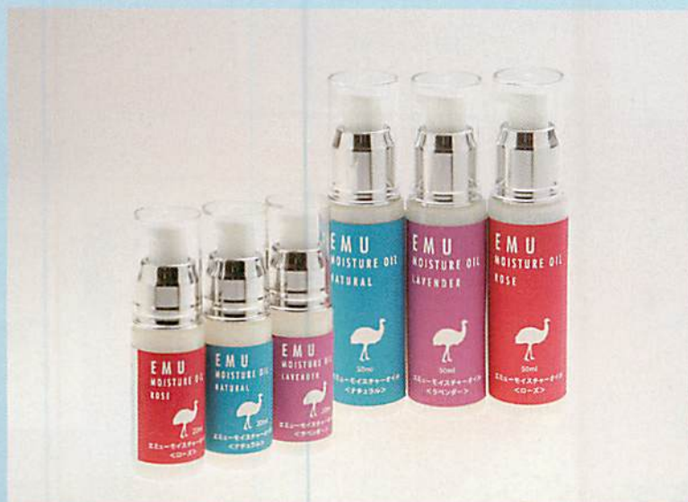
無臭タイプのほかに、バラやラベンダーの香りをブレンドした商品もある

スキンケアのほかに、炎症や腫れ、筋肉疲労などの痛みを軽減する効果もあると見込まれており、その機能性について現在も研究が進められている。エミューは新たな地域資源として期待されている。