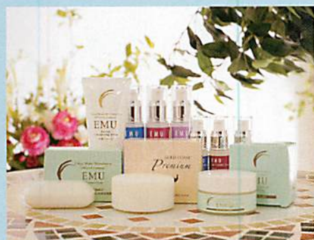
同じくエミュー油を使用したクリームやソープも展開