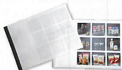
※当社の使用している実績パンフレットです。

デザインは流行に影響されやすいものですし、一人のデザイナーが永く関わると飽きやマンネリが来るものです。力のあるデザイナーを見つける事も売り上げ向上のためには重要なポイントです。