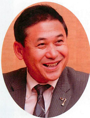
サッカー女子日本代表 (なでしこジャパン)