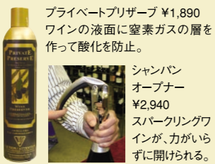
(株)ワインの寿屋 札幌市中央区南2条西24丁目1-1 TEL: 011-611-3383 http://www.wine-kotobukiya.com/

ワインを保存するグッズ、簡単にかけられるオープナーなどのグッズをプレゼントすると、ワイン好きに喜ばれると思います