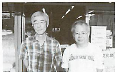
源光理事長(左)と渡辺専務