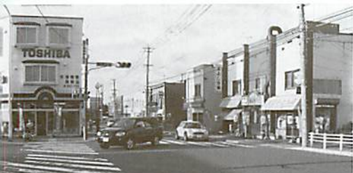
発寒商店街の街並み