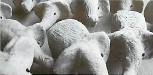
東野さんの作品。和紙で作った「手乗りゾウさん」