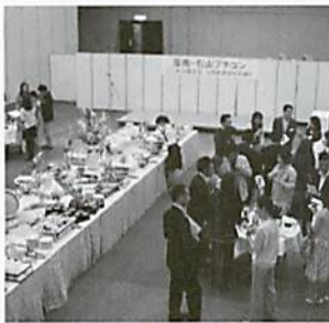
男性参加者は南区商店街加盟店の経営者・後継者が中心