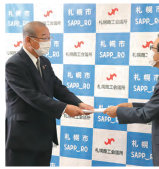
新型コロナウイルス感染拡大に伴う要請書の手交

◆地方創生推進 ①学生論文コンテスト「札幌の進むべき道を考える」 札幌の将来を担う学生による地方創生の促進やまちづくりへの参画意識の向上を目的に論文コンテストを実施する。