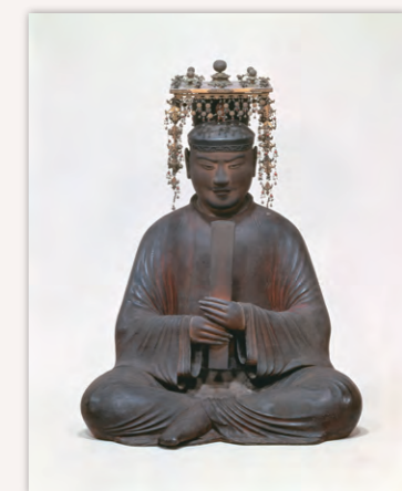
国宝「聖徳太子および侍者像」のうち聖徳太子(法隆寺蔵)

聖徳太子は仏教の信仰に厚く、法隆寺や四天王寺などを建立したと伝えられる。2021年に太子1400年御遠忌を迎えたことを記念し、法隆寺において守り伝えられてきた寺宝を中心に中宮寺および太子ゆかりの斑鳩の諸寺に伝わる国宝、重要文化財を中心に紹介。