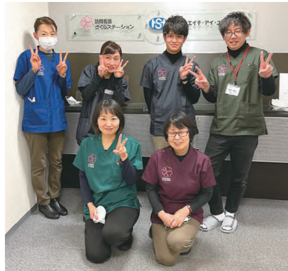
在宅療養を支援する訪問看護さくらステーションのスタッフ

とが可能だったのだろうか。 「たまたま長男が看護師として働いていて、結婚相手も看護師。私の妻も看護師で、さらに次男の妻と、その母、姉、めいっ子も看護師。家族の医療スキルを生かして事業の存続や継承につなげるとともに、社会貢献もできると考え、高齢社会のニーズが高い訪問看護に着目し、家族と相談して新事業としてスタートしました」