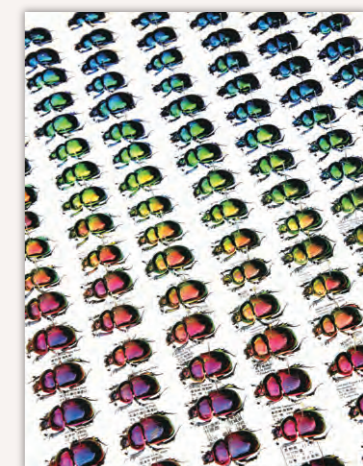
オオセンチコガネ

子どもたちが自然科学に興味を持つ身近な扉となっている「昆虫」。その進化の過程は複雑で、地球上には多種多様な昆虫が生息し、現在でも進化を遂げている。本展では、国内の博物館、大学、個人が所蔵する10万匹を超える昆虫標本を展示。昆虫の多様性を体感する展示と併せて、SDGsの観点からも「人と昆虫」の関わりと重要性を紹介。ミヤマクワガタなどの巨大昆虫模型にも注目!