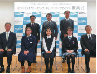
キャリアリサーチコンテスト授賞式