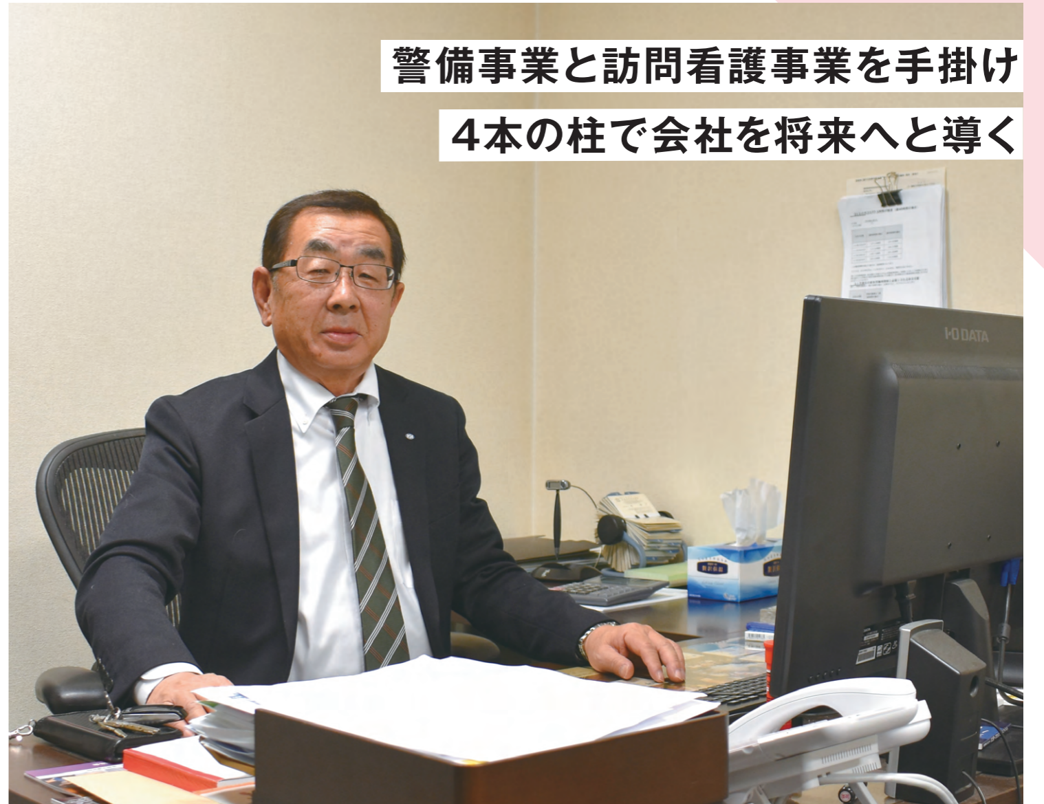
株式会社エイチ・アイ・ユーザーサービス 代表取締役社長