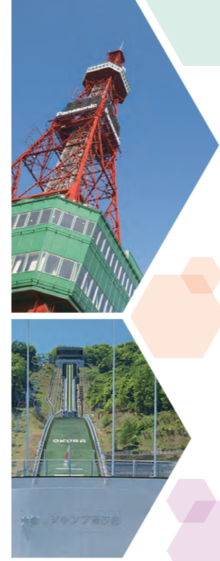
札幌テレビ放送塔

SNSを用いた発信力の強化を望む中小企業と、地元企業と接点をもちたいと考える大学・高校生をマッチングし、若い世代からの認知度向上を図り、若年層の採用力向上を目指す。