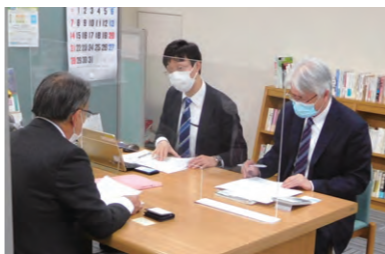
マンツーマン相談会