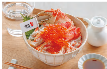
道内各地から厳選された商品を仕入れ おすすめレシピも紹介している