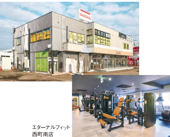
エターナルフィット 西町南店

企業に出張して、運動教室を行う取り組みを増やしていきたいと考えています。従業員の健康は企業の売り上げに直結し、健康維持に運動は欠かせないものです。運動と売り上げは直接結び付かないように見えますが、結果として企業全体の活力につながるのです。運動することで気分が明るくなりますし、肩こりなども少なくなり、作業効率も上がります。 健康経営優良法人の認定取得のための企業のサポートももっと手掛けていきたいですね。