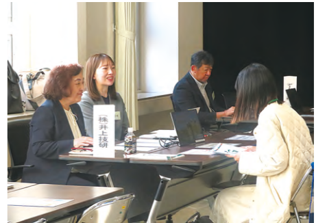
企画広報部 人材確保・活用課

就職活動を控える弘前大学の学生を対象に、合同企業研究会を開催した。北海道、札幌の企業を中心に20社がブースを構え、同大学に通う人文社会科学部、理工学部、農学生命科学部などの学生に対して自社のPRを行った。