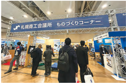
産業振興部 情報・ものづくり課

道内各地の優れた技術や製品を有する企業が一堂に会する道内最大級のビジネス展示会として知られる「ビジネスEXPO」会場内に「札幌商工会議所ものづくりコーナー」を出展し、会員企業のPRおよび販路拡大を支援した。同コーナーには14社が出展した。