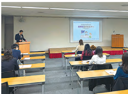
産業振興部 国際・観光課

ものづくり工業部会では、理工系学生の北海道定着、ものづくり産業の振興などを目的に、道内学生の製品化・事業化アイデア実現支援事業を実施しており、第8回目となる「学生アイデアプレゼンテーション」を開催した。