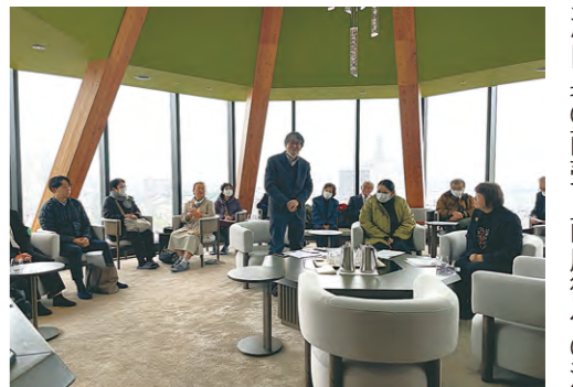
中小企業相談所 白石支所

続いて、参加者同士が自身の商売・商店街への活用方法を検討・共有していくワークショップを実施。参加者からは、「スマホならではの縦型動画の作成・活用について興味を持った」「商店街の平日の催事計画がたっくさんあり驚いた」との声が寄せられた。