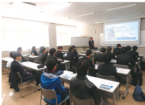
企画広報部 人材確保・活用課

小樽市にある北海道職業能力開発大学校にて、同校に在学する応用過程1年生(2027年3月卒業予定)を対象に合同業界研究会を開催した。当日は複数の教室を会場として建設・電気工事・設備工事・IT業を中心に企業25社、学生75名が参加した。