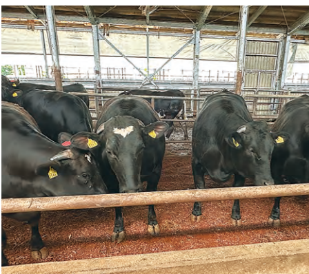
顧客農場の肥育牛

(株)BRASTは、酪農家や畜産農家に対して産業動物獣医療を提供する家畜診療所である。また、一般診療業務だけではなく、獣医学的視点に基づく「疾病予防強化」や、飼養管理改善を中心とした「生産性向上につながる獣医療」を実践する畜産酪農コンサルティング会社として、農場の経営改善にも取り組んでいる。2017年の創業以来、一貫して増収が続く、業界内での認知度向上とともに契約農場数および顧問企業数も大幅に増加していた。しかし、これまでのように仕事の依頼を待ったり、顧客農場や農場関連企業から口コミで農場を紹介してもらったりする受け身の体制では、今後安定した会社経営が困難であると感じていた。そこで、小規模事業者持続化補助金の利用を決定。ホームページを今後構築し、会社概要の掲載、遠隔診療の受け付け、問い合わせ窓口の整備などとともに、サプリメント飼料