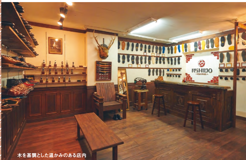
木を基調とした温かみのある店内