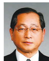
吉本理事・特別顧問

ど、多様な工夫が施されたオフィスを見学した。9社11名が参加し、見学後にはオフィスづくりに関する意見交換も行った。