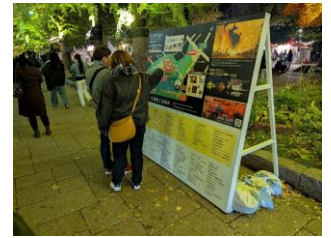
※写真は2025年のものです。