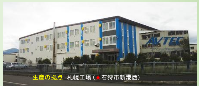
生産の拠点 札幌工場(★石狩市新港西)