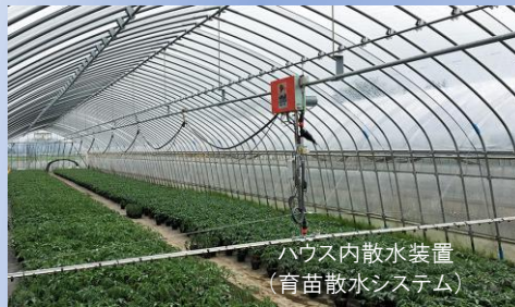
ハウス内散水装置 (育苗散水システム)