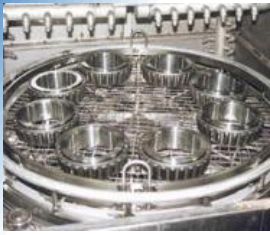
列車軸受洗浄装置 (大手鉄道旅客会社向け)