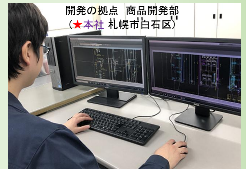
開発の拠点 商品開発部 (★本社 札幌市白石区)

営業部門もニーズ調査や製品企画で、開発を後押ししています。また定期点検など製品維持はメンテナンス専門の技術者が対応。その情報も、新たな新製品開発に反映しています。