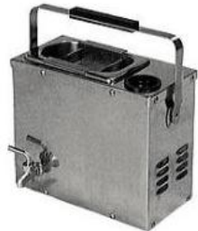
ビールサーバー洗浄機 (大手ビールメーカー向け)