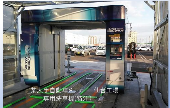
某大手自動車メーカー 仙台工場 専用洗車機(特注)