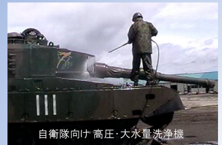
自衛隊向け 高圧・大水量洗浄機