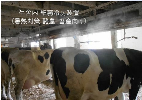
牛舎内 細霧冷房装置 (暑熱対策 酪農・畜産向け)