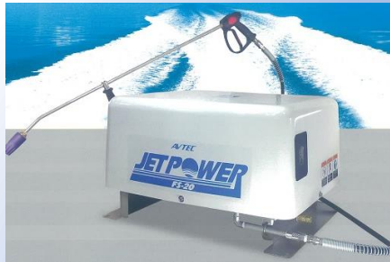
漁業向け 船舶搭載洗浄機 (漁業組合・漁業者向け)