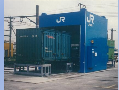
貨物コンテナ洗浄装置 (貨物運輸関係向け)