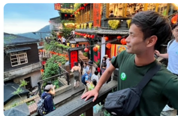
5年に一度の海外研修