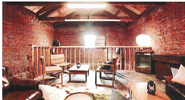
煉瓦造りの空間（Apple Lodge 2F）

当社はこのりんご蔵を拠点に、今年6月から月2回ほど地域密着型のマルシェ「平岸マルシェ」を開催。（8月26日と9月12日は緊急事態宣言下のため中止）その他にも「平岸の醸造所で生まれたクラフトビールのビアガーデン」や「コロナ禍で行き場を失った食材を使う期間限定のフレンチレストラン」なども開催しました。