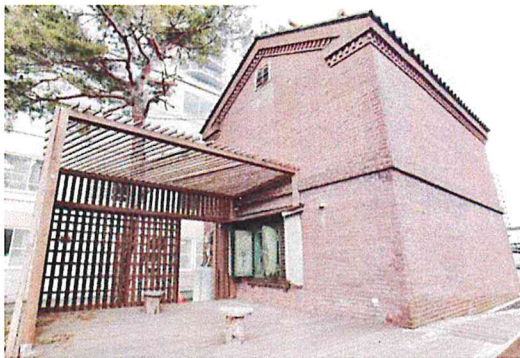
Apple Lodge（柳田家住宅旧りんご蔵）

このBAR Apple Lodge（アップル・ロッジ）では、「タクシードライバーの新しい働き方に挑戦したい」との考えから、現役ドライバーがバーテンダーも務める形で通常営業を開始します。また地域の貴重な文化財である旧りんご蔵の建物自体も貸切で提供。「期間限定でレストランや飲食店を出店」「イベントや個展の開催」「新業態の挑戦の場」など、さまざまな企画やイベントの会場として活用していただけます。