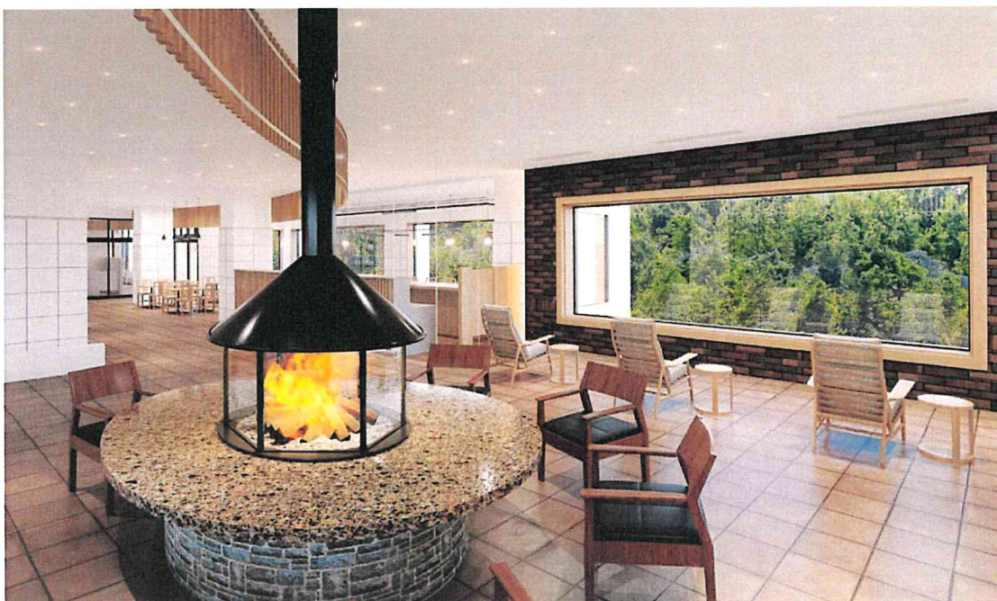
1F エントランス「山と鼓動」(イメージ)

雄大な旭岳の景観を堪能しながら寛げるロビーラウンジには、あたたかな暖炉。新たに音響設備を整えたミニシアターと、自然や歴史、旅など様々なジャンルから選書したライブラリースペースも設けました。長編小説をゆっくり読み進めたり、お気に入りの映画の世界に浸ったりと、思いおもいに豊かな時間をお過ごしいただけます。大きな窓からは旭岳と太古の森を眺め、珍しい野鳥も訪れる。広いスペースは区切り方やテーブル配置も可動でき、ワーケーションにも対応可能(Wi-Fi・備品貸し出し)。お一人様~グループ利用まで多目的に使えるよう工夫も凝らしました。