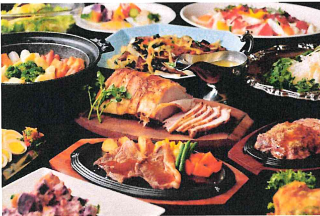
レストラン(buffet料理イメージ)

ホテルがある東川町は、大雪山の清らかな伏流水によって育まれる野菜の美味しさも自慢。地産地消にこだわり、料理長が信頼のおける生産者のもとへと訪ねて厳選した、旬の食材をふんだんに盛り込んでいます。メイン料理はA・Bから選ぶことができ、6月オープン時はA 星空の鉄板焼から「道産肉の鉄板焼」B 天空のグリルからは「十勝ハーブ牛グリルステーキ」のできたてをテーブルへお届けします。セカンドメニューのほか、デザートまでbuffet形式となっており自由にお楽しみいただけます。近年注目を集めている北海道産のワインも豊富にご用意しています。