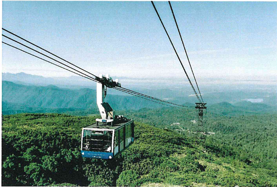
大雪山旭岳ロープウェイ