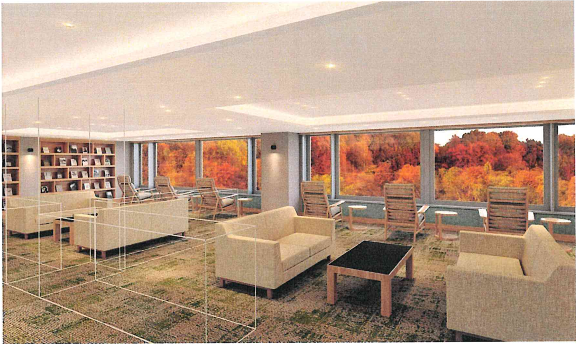
2F ライブラリー&癒しスペース「森といこい」(イメージ)