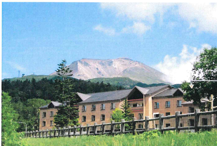
ホテルベアモンテと旭岳

旭川空港から車で約1時間と、全国各地からもアクセスしやすい「ホテルベアモンテ」。 北海道最高峰・旭岳(2,291m)のふもと、大雪山国立公園の中にある当ホテルは、標高約1,100mに位置します。 大雪山系の山々は珍しい高山環境を持ち、固有種をはじめとする色鮮やかな高山植物や高山蝶、野生動物など、国の天然記念物にも指定された動植物が多数生息しています。日本で一番早い紅葉の名所としても知られ、山頂の冠雪とのコントラストは非常に見応えがあります。ホテルから徒歩3分で「大雪山旭岳ロープウェイ」の乗り場もあり、5合目(約1,600m)の姿見駅周辺は、登山の装備をせずに気軽に自然を楽しむことも可能。古くからアイヌの人々に“カムイミンタラ(神々の遊ぶ庭)”と称され、大切にされてきた圧倒的な大自然を間近に体感できます。