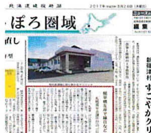
新聞掲載 (8月24日) 北海道建設新聞