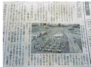
新聞掲載 (8月27日) 北海道新聞