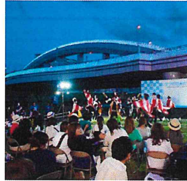
【川に人が集まることによって、家族が安心して川遊びができるようになった光景】