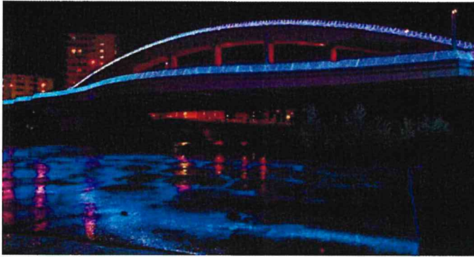
【夏は倉庫に眠っているホワイトイルミネーションのLEDをお借りして幌平橋をライトアップ】