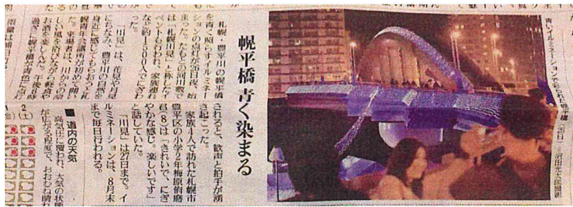
新聞掲載 (8月27日) 読売新聞