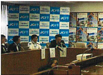
記者会見 (8月10日) 札幌商工会議所会議室