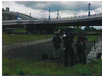
記者会見後取材 (8月10日) 豊平川河川敷