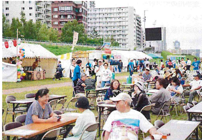
【メディア掲載一覧】