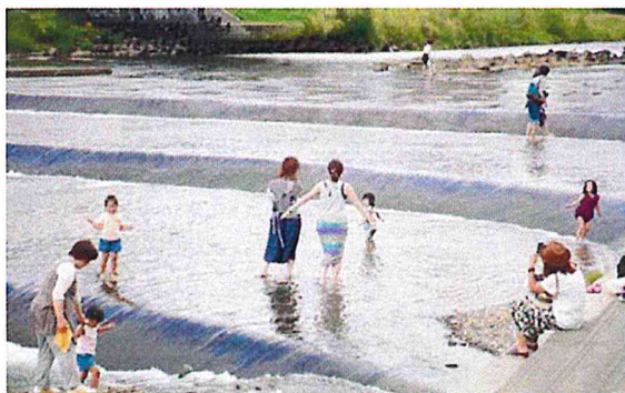
河川敷に人が集まると、流れのないところで川遊びする光景が生まれます。都心にいながら自然に触れられる貴重な場所。

私たちは、豊平川の河川敷や中洲、または橋といった活用しきれない場所を、たくさんの人たちが集まりやすい場所にしていくことを目的としております。代表的な事業として、2017年にスタートした川見があります。幌平橋やその河川敷を活用し、「春は花見、夏は川見」というキャッチフレーズで2日間にわたり開催しました。2日間の動員数は、2017年で約3,000名。18年で約6,000名。19年には13,000名を超えました。市民の期待値はこの数字からも大きなものと考えております。今までは札幌青年会議所の事業として開催しておりましたが、それでは通年の事業として専念することができないので、2022年川見を生み出した当時の有志メンバーによって株式会社川見を設立し、豊平川を活用した事業を通年展開し、夏と冬に大きな川見と炎見という事業を開催してまいります。本年は8月19日（土）20日（日）を川見の開催日とします。