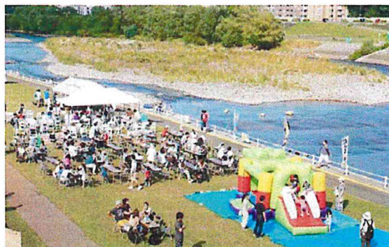
自然を残した雄大な河川敷と中洲には可能性で溢れています。豊平川を、自然とたくさんの人たちが集まる場所に。

川見は、実現不可能からスタートしました。過去に河川敷に屋台を出し、川の近くでたくさんの人を集めるイベントがなかったからです。開発局や札幌市にも開催の道を、見えない糸を辿る様に諦めずに交渉を続けました。最終的には、開発局や札幌市も共催という形でこの壮大な社会実験が実現しました。開催の準備をしている間も幌平橋を通る多くの人たちが興味を示してくれて、各メディアも大いに取り上げてくれました。当初1,000名の来場を目標としていたところ3,000名を超えた時の喜びは今でも覚えています。来場者も「こんなことがしたかった」「毎日この橋を通っていたけどこんな素晴らしい川だったんだ」など多くの声をいただきました。開催2年目の準備期間には、スタッフが通り過ぎる方から「今日は川見日和だね」と言葉を聞いたほどです。