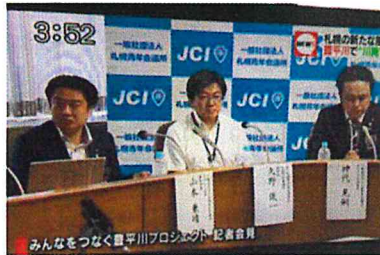
記者会見放送 (8月10日) STV どさんこワイド