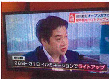
記者会見放送 (8月10日) HBC北海道放送 今日ドキッ!