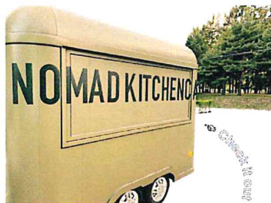
新キッチンカー [NOMAD] 式号機

地域の賑わいを創出するイベント「平岸マルシェ」が、2021年夏も開催されることになりました。そこで初の出店をすることになったのは、ノマドデザイン株式会社が運営する、今春オープンしたばかりのタイガーカレーのキッチンカー、「ノマドキッチンカー」です。