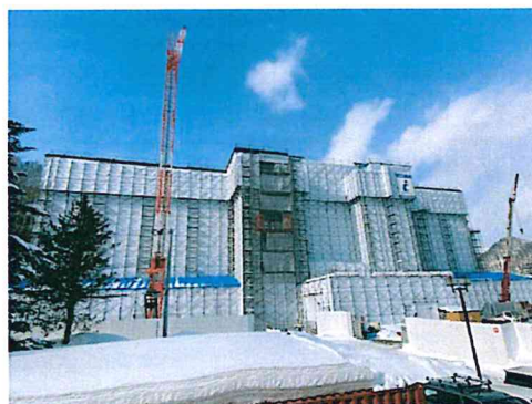
建築現場の様子(2021.2月下旬)