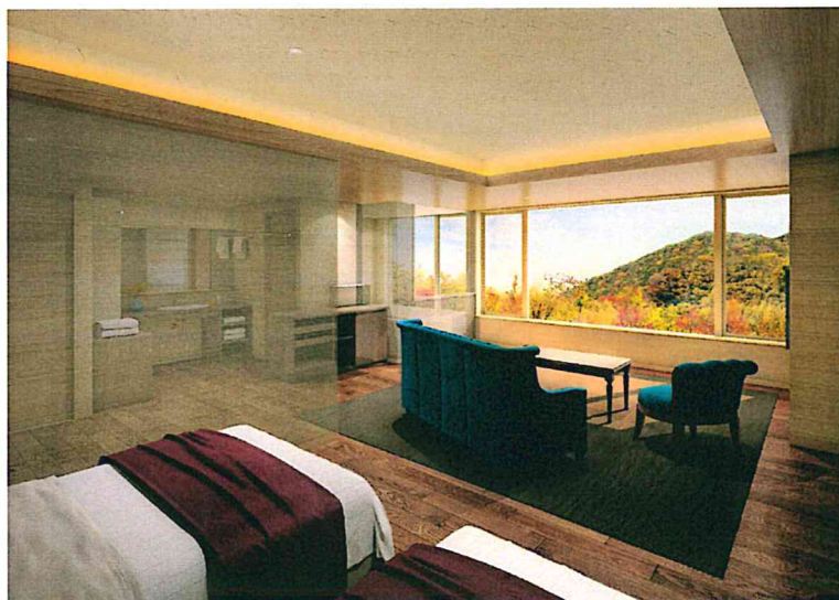
客室 [展望ラグジュアリー（50㎡）]

お部屋はスイート仕様 50㎡の広さを確保した展望温泉付きのラグジュアリー・和洋室・ユニバーサルツイン・ツインの他、スタンダードツインの5タイプ全68室（全室禁煙）。このうち58室は展望温泉付きで、季節の眺望とともにいつでも新鮮な温泉をご満喫いただけます。全室大きな窓から渓谷が眺められ、最上の眠りを導くベット、独立した洗面台、トイレを完備。静寂性と居住性にこだわります。