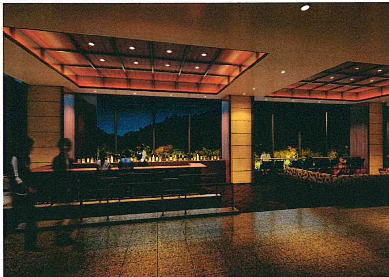
カフェバー [ラベンダー]

レンガやトラバーチンでしつらえられた落ち着いた雰囲気。渓谷カウンターやボックス席がございます。窓の向こうに眺める夏の緑、秋の紅葉、美しい夜空と色鮮やかなカクテル、静かな音楽とともに大人の時間をお楽しみください。