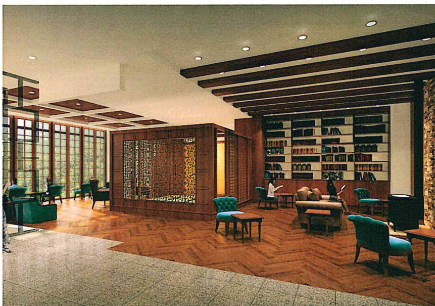
ライブラリー・茶室

自然、旅、歴史など 300 冊を超える蔵書が閲覧できるライブラリーやアイヌ文様をあしらった金の茶室に暖炉など、ゆったりと流れる時間とノスタルジーを感じていただけることでしょう。懐かしくも新しい、そんな空間をご提供します。