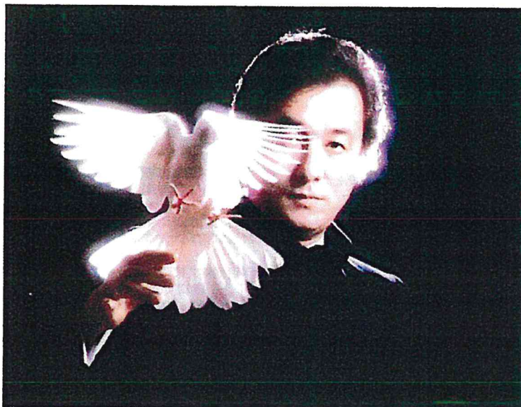
初代引田天功 1 st TENKO HIKITA (1934年7月3日～1979年12月31日) “平和の鳩より”