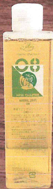
MISONO MATERIAL SHAMPOO RIN