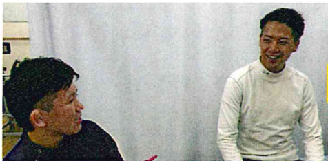
細かくお身体のことを伺います