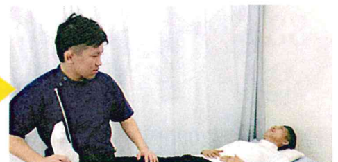
身体を根本改善に導いていきます