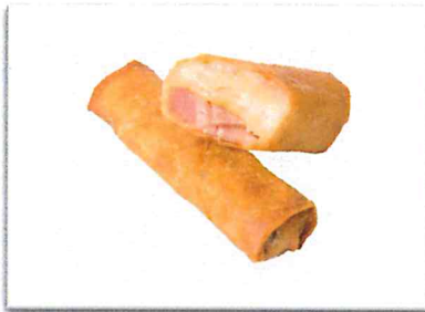
ベーコンポテトチーズ 220 円