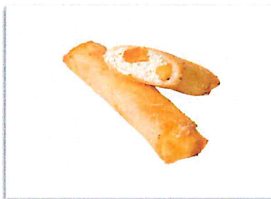
りんごレアチーズ 220 円