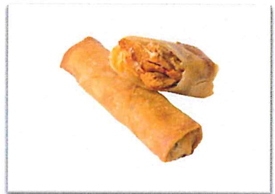
豚角煮 220 円