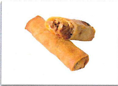
ジンギスカン 220 円