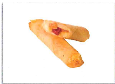
いちごカスタード 220 円