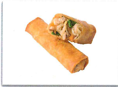
春雨 GALAXY 220 円