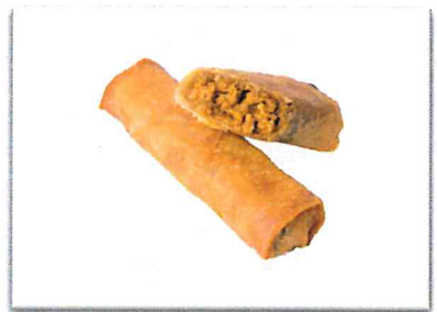
キーマカレー 220 円