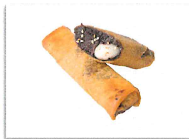
ごま団子 220 円