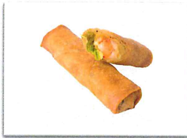
エビマヨ 280 円