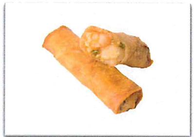
海鮮中華 280 円