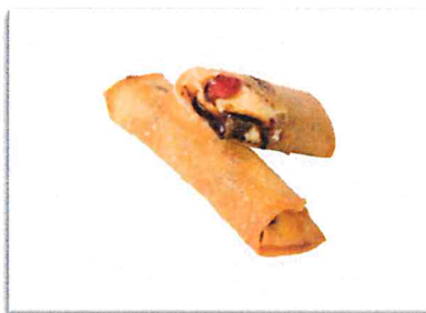
いちごブラウニー 220 円