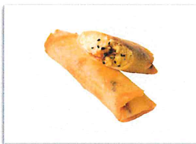
大学芋 220 円