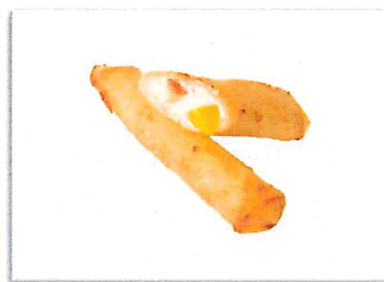
パインココナッツ 220 円