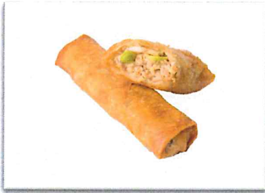
ツナマヨ 220 円