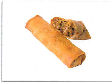
焼肉 220 円