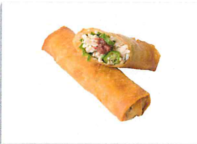
梅しそササミ 220 円