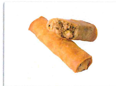
餃子 220 円