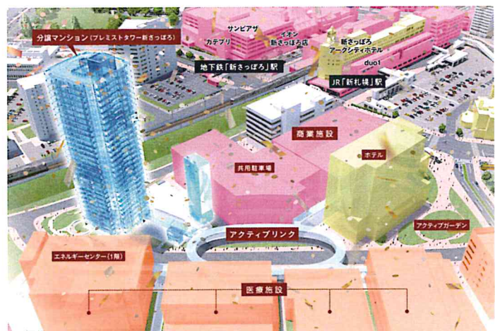
I街区 構成および「アクティブリンク」