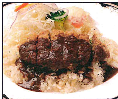
当店特製 再群来メンチエスカ 800円 (880円)