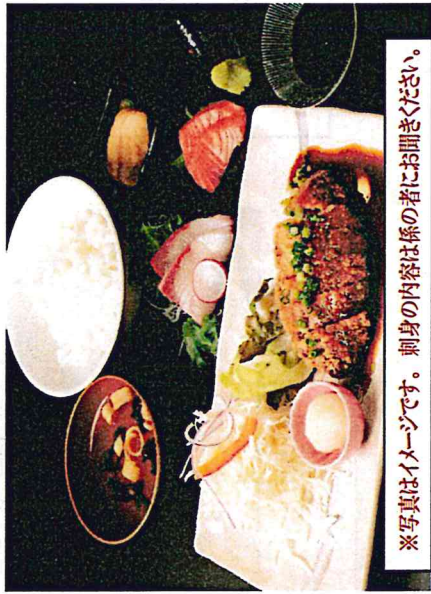
※写真はイメージです。刺身の内容は係の者にお聞きください。