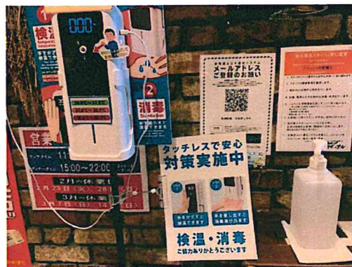
感染対策を徹底している店内