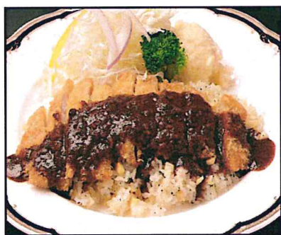
根室名物 エスカロップ800円 (880円)