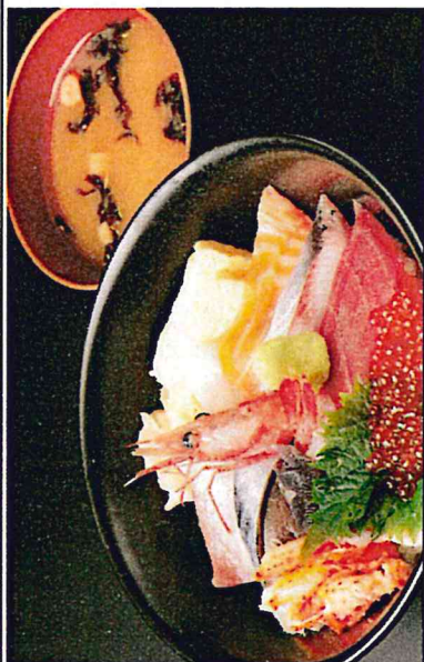
※写真はイメージです。ネタは日によって替わります。味噌汁付き