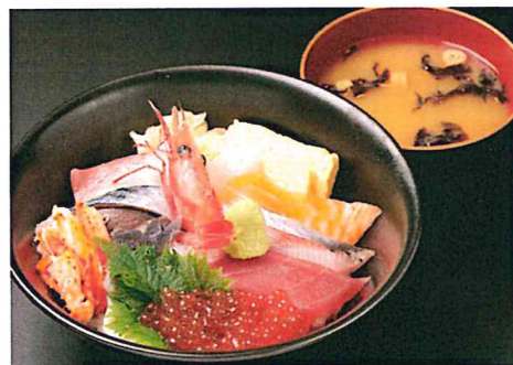
海鮮丼 (10種) 900円 (990円)