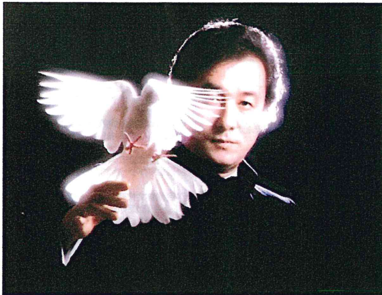
初代引田天功 1*TENKO HIKITA (1934年7月3日～1979年12月31日) “平和の鳩より”