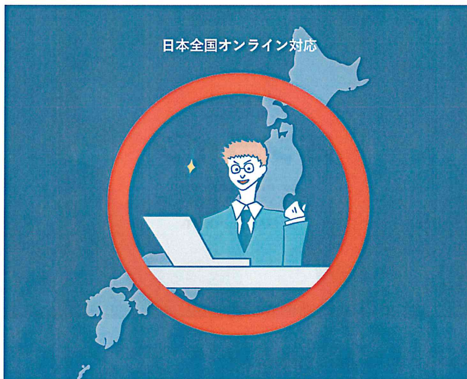
日本全国完全オンライン対応

これらの課題解決・メリットを踏まえたうえで、『税理士オンライン』は「ただオンラインなだけ」のサービスとは一線を画す質の高いサービスを提供します。