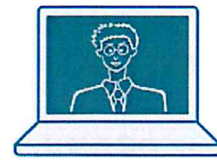
テレビ会議システム