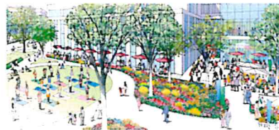
【アクティブガーデン イメージ】