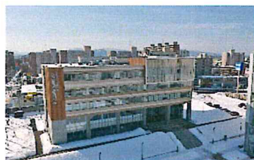
【札幌看護医療専門学校 外観】