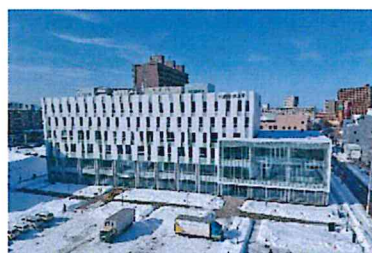
【札幌学院大学 外観】

両校は、学術交流協定を締結しており、地域を結ぶ「産学連携」においても推進していきます。