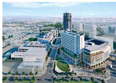
【I街区完成イメージ】