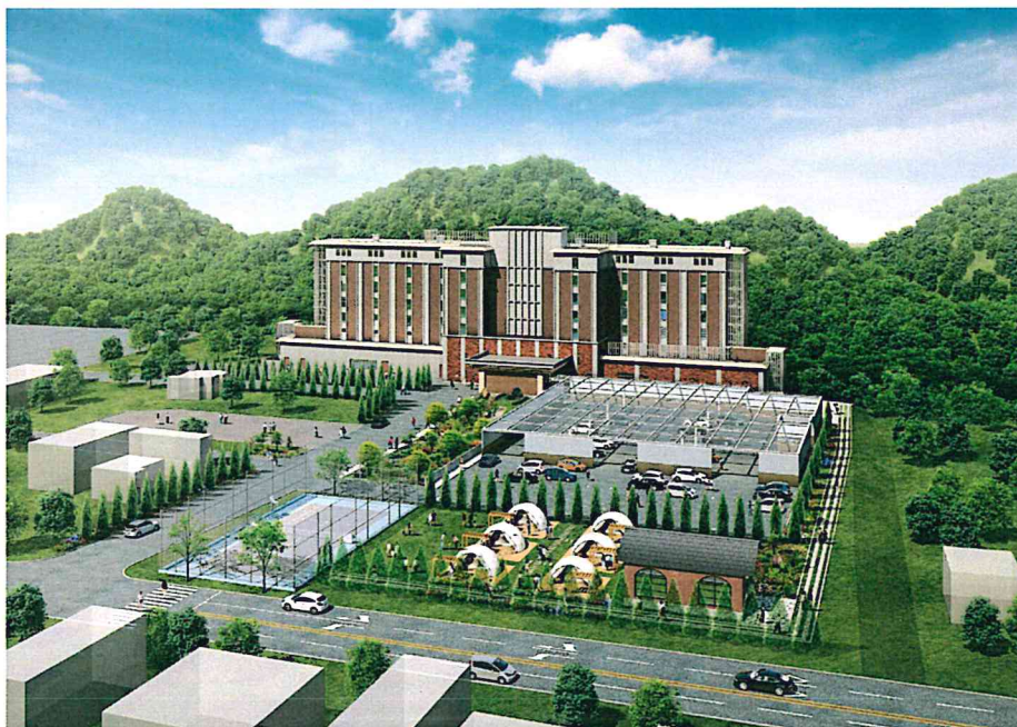
国道側(夏)イメージ

ホテルを囲むゆとりの敷地、川が流れ、山々を望み、国道からは別世界へと続く豊かな緑のアプローチ。 ホテル全体で【四季の自然を取り込む癒し空間】を演出しながら、人生100年時代、個が豊かに過ごせる【私らしい時空の旅】をテーマに優美と快適性を実現します。