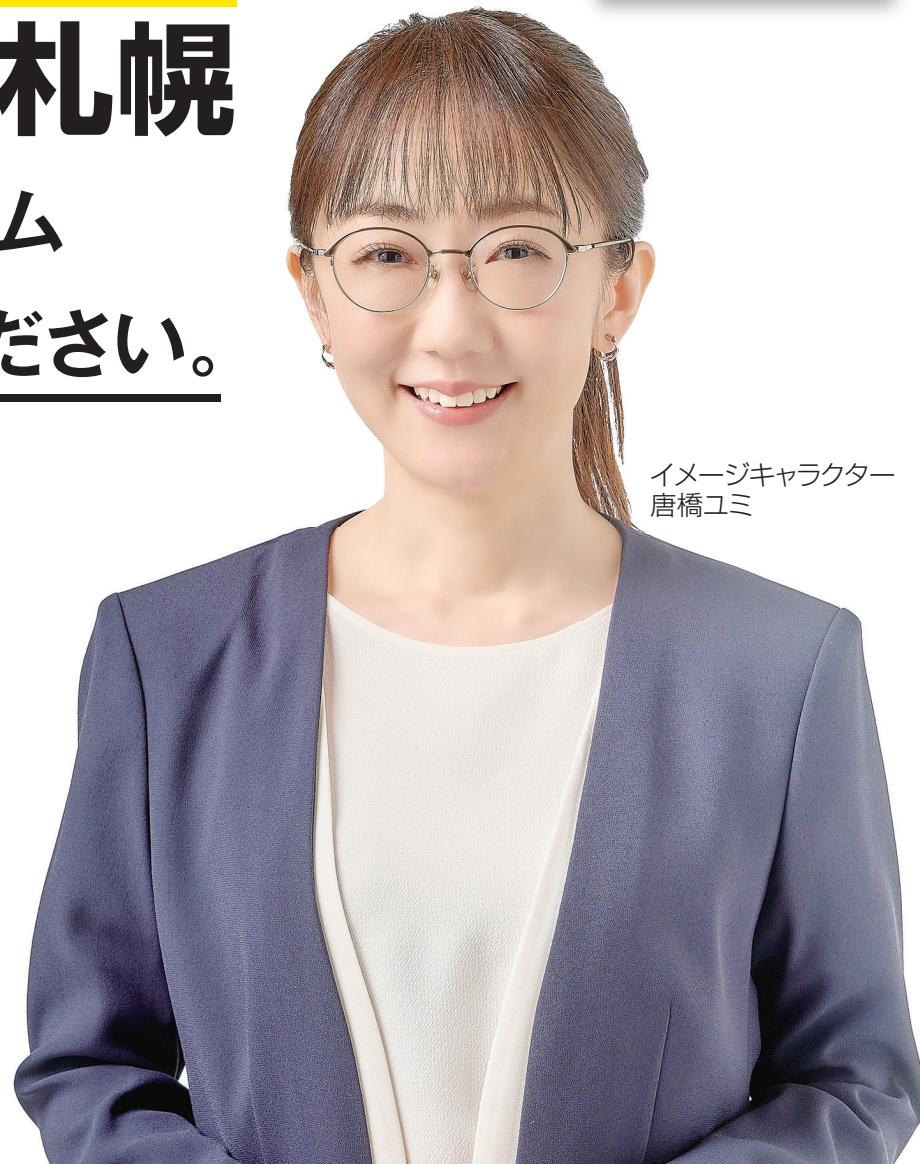
イメージキャラクター 唐橋ユミ