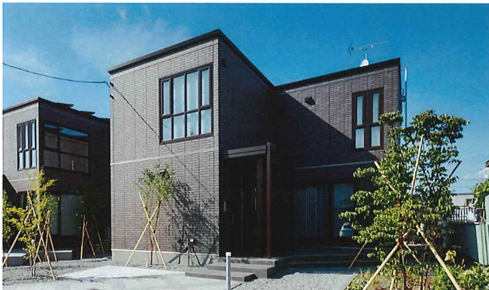
『買取り保証 ※1 』付き「ザ・デザイナーズハイム」分譲住宅の例（旭川市東光1条5丁目N0.2）

北海道セキスイハイム株式会社（本社：札幌市、代表取締役社長：村松 正臣）は分譲住宅ブランド「ザ・デザイナーズハイム」の『買取り保証 ※1 』を開始します。