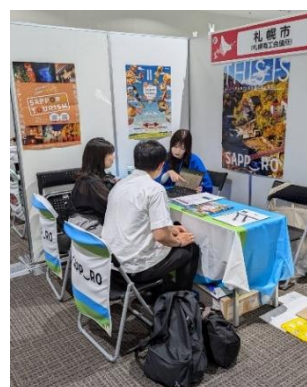
9/27・28 北海道移住・交流フェアin大阪