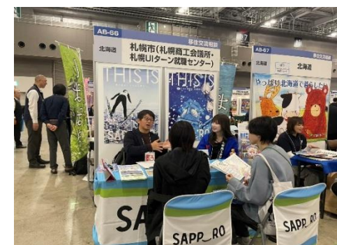
12/7・8 JOIN移住交流フェアin東京