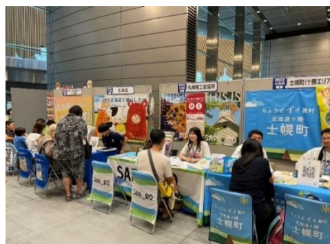
9/21・22 ふるさと回帰フェアin東京