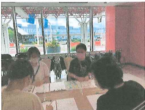
昨年のセンターの様子