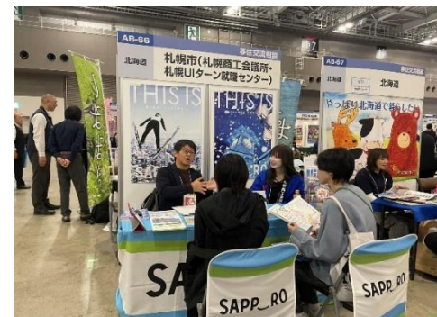
12/7・8 JOIN移住交流フェアin東京