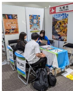
9/27・28 北海道移住・交流フェアin大阪