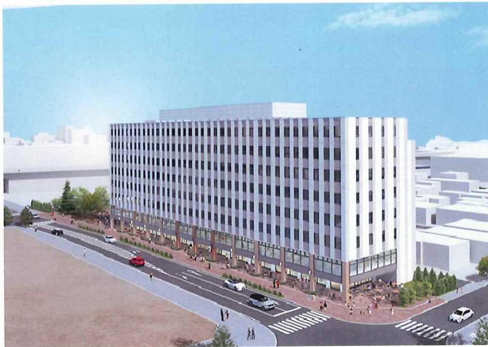
サッポロ不動産開発株式会社 N4E4ビル（仮称）外観イメージ

本事業は、当社が札幌で手掛ける再開発事業としては、2017年のTDYショールーム（札幌市中央区北3条東4丁目／旧サッポロファクトリー第3駐車場区画）以来となります。札幌市の「都心における開発誘導方針」に基づき、北海道新幹線の札幌延伸等による周辺環境の変化を捉え、新たな働き方に対応するオフィスを中心とした8階建ての複合型商業・オフィスビルとして2024年8月のグランドオープンを予定しています。