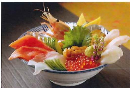
本日の海宝丼 4,800円（税込）