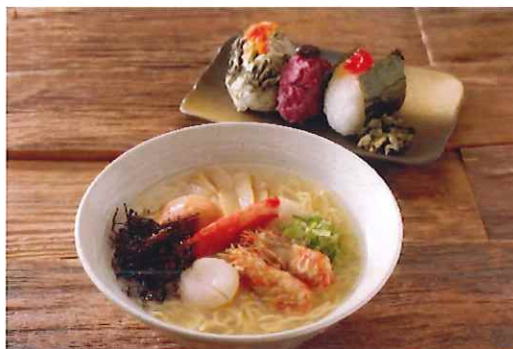
【数量限定】海鮮帆立潮ラーメンセット 1,900円（税込）