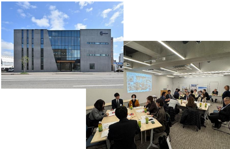
令和7年度訪問 〈和光ホールディングス オフィス〉