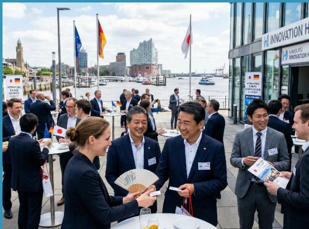
国外企業交流・視察会

国内および海外のICT関連企業とのビジネスマッチングを目的に、先端技術を持つ企業や地域への交流・視察会を実施する。