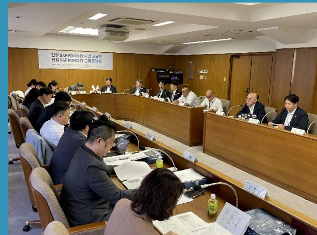
令和7年度実施事業 日韓ITビジネスフォーラム