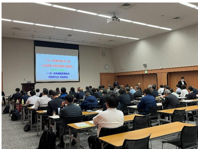
<R7. 労務費調査の勉強会>