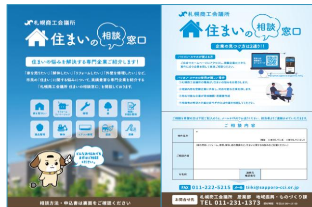
市民向けPRチラシ (R6リニューアル)