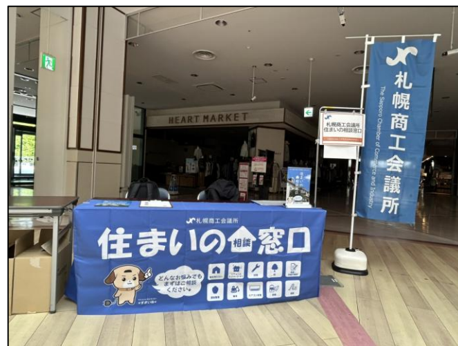
R7. 5. 30 平岡イオンにてPR