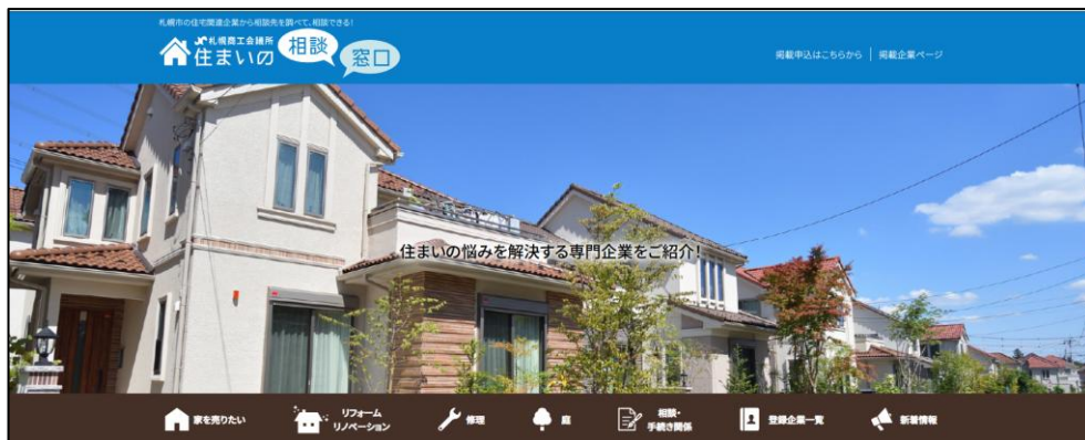
住まいの相談窓口HP