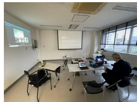
<札幌地方協力本部→滝川駐屯地へ配信>