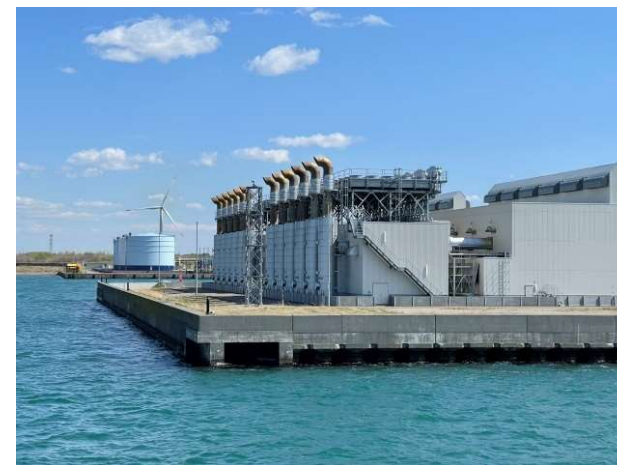
<北ガス石狩発電所>