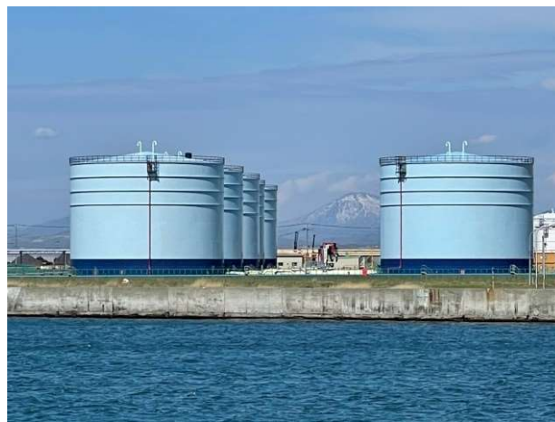
<オイルターミナル>