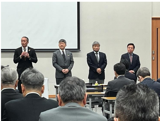
<正副部会長選任部会>