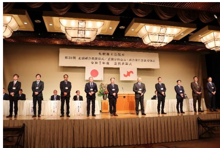
<正副部会長就任式・委嘱式>