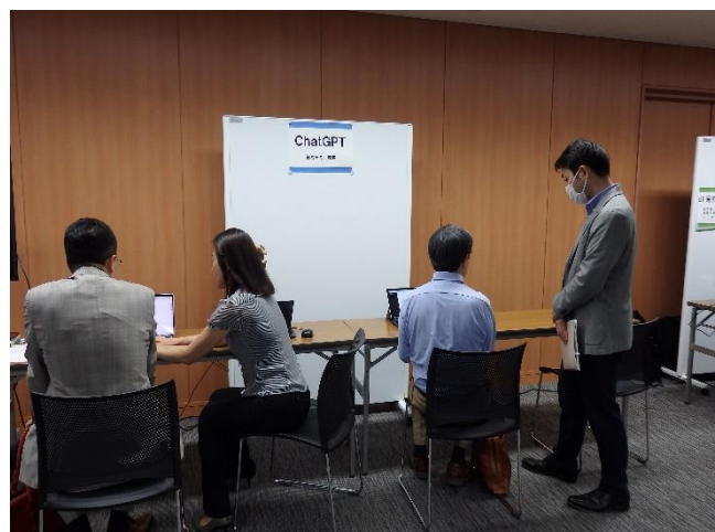
<デモ機体験中の様子>