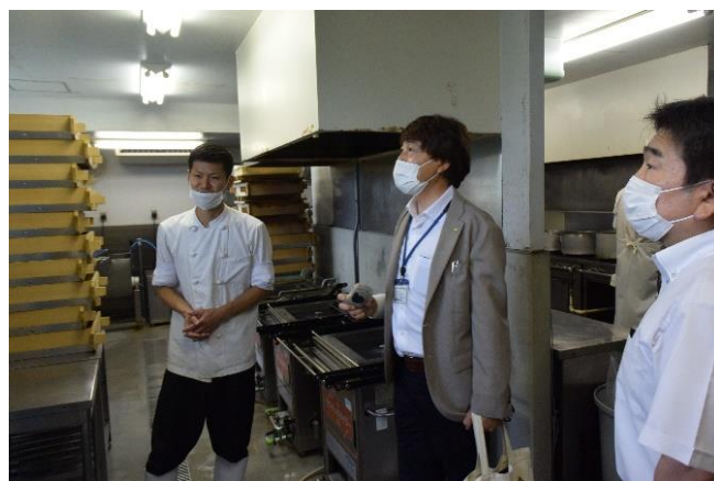
<省エネ診断②ヒアリングの様子>