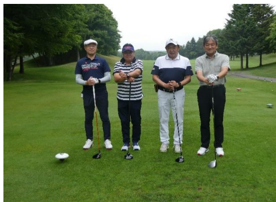
<スタート前集合写真②>