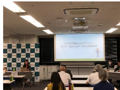
<セミナー当日の様子>

最終回となる第3弾は、「企業ブランド力の向上や新規採用に必要な社内体制」をテーマに10月20日（金）に開催予定。