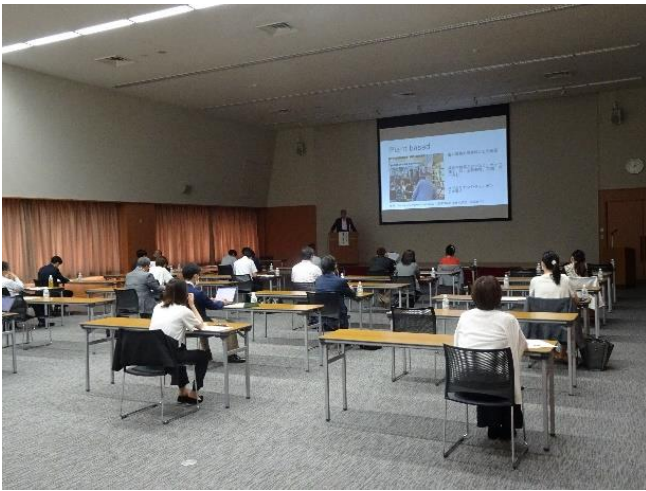
<セミナー当日の様子>

事後アンケートでは、「買い手の気持ちがよくわかる内容だった」「商談のテクニク的なことだけでなく、本質的な部分を学ぶことができ、勉強になった」「直近のアメリカのトレンドなど、海外の生の声に言及されており勉強になった」など、大変参考になった旨の声が多数寄せられた。