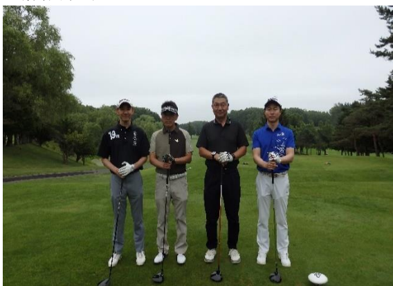
<スタート前集合写真①>