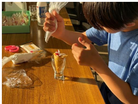
<フェイクフード展示会・制作体験>