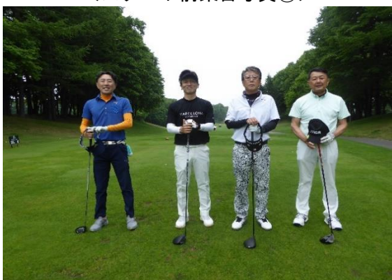
<スタート前集合写真③>