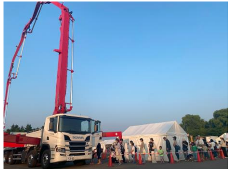
<車両展示・おしごと体験の様子>