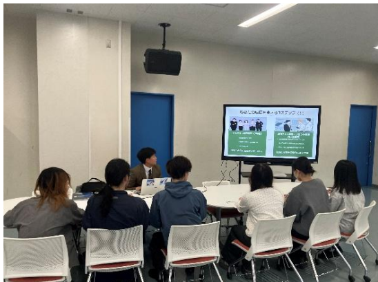
<個別ミーティングの様子>

5月19日（火）、製造業が抱えるIT関連の課題などに対し、学生が解決に向けた提案を行う「クリエイティブ・ミートアップ」を、北海道情報大学の協力の下で実施した。当日は、ものづくり工業部会に所属する企業3社と学生21名が参加した。各企業からは、ホームページやSNSを活用した広報・採用活動、DX推進による業務効率化など、現在直面している課題について説明が行われた。参加した学生からは、「企業ごとに課題のあり方も様々であることを学び、大変刺激を受けた」「自分たちの得意な事、学んできたことを駆使し、直面する課題の解決に挑みたい」といった前向きな感想が寄せられた。今後は、各企業が提示した課題の解決に向けて、学生たちがより深く調査・研究を進めていく予定である。