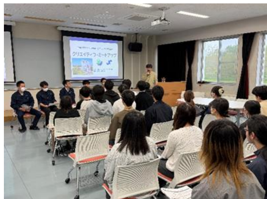
<全体ミーティングの様子>